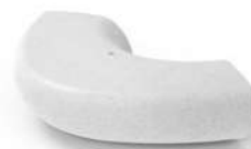
C - 120°